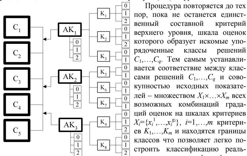
Рис. 1. Схема построения критериев и формирования шкал оценок

оценок которых представляет собой новые объекты классификации в сокращенном признаковом пространстве, а классами решений будут теперь градации оценок на шкале составного критерия (i+1) -го уровня.